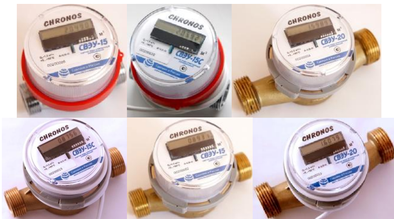
Рисунок 4 – Общий вид счетчиков типоразмера 4

Схема пломбировки от несанкционированного доступа, обозначение места нанесения знака поверки представлены на рисунке 5.