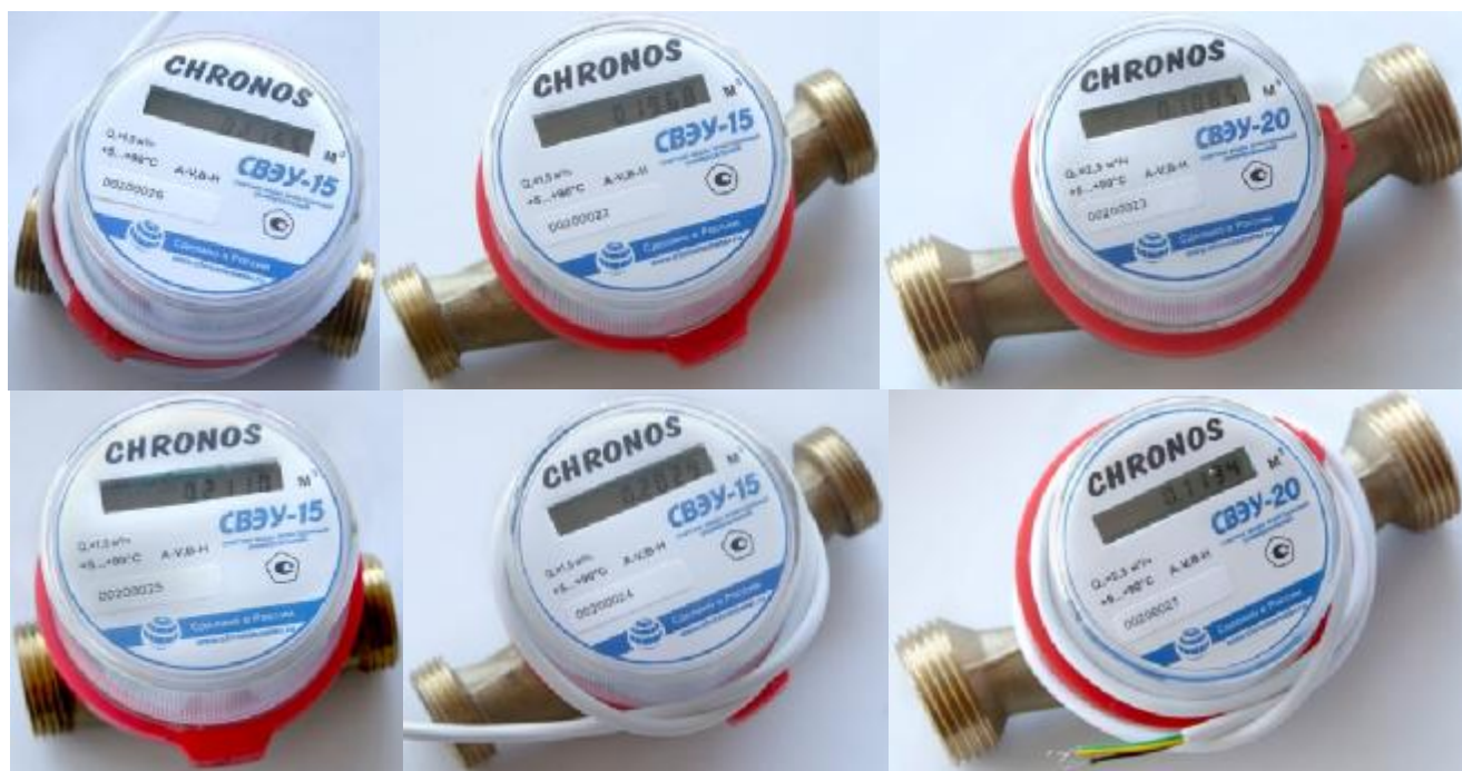
Рисунок 3 – Общий вид счетчиков типоразмера 3