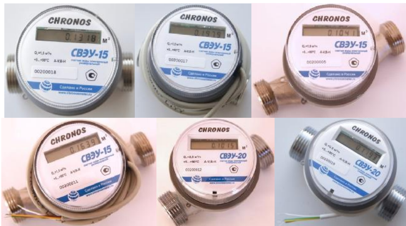
Рисунок 1 – Общий вид счетчиков типоразмера 1

Общий вид счетчиков представлен на рисунках 1-4.