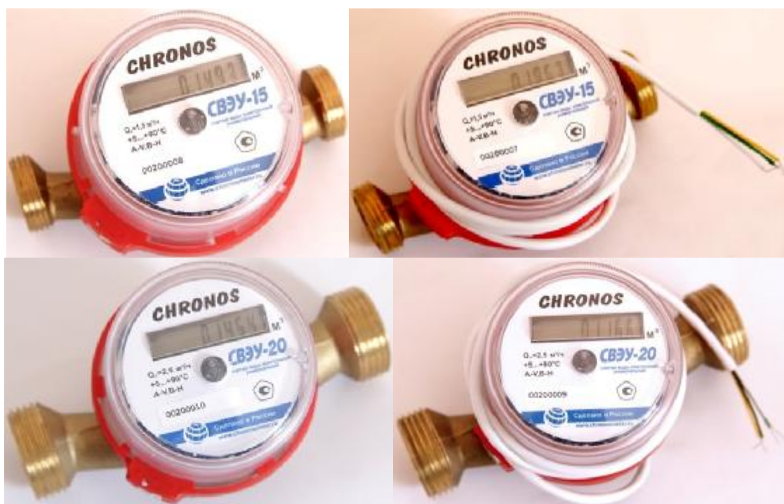
Рисунок 2 – Общий вид счетчиков типоразмера 2