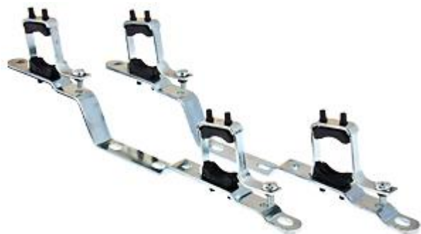
ПАРА КРОНШТЕЙНОВ КОЛЛЕКТОРНЫХ

Производитель: VALTEC s.r.l., Via Pietro Cossa, 2, 25135-Brescia, ITALY